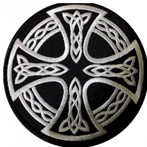
Рисунок 2. Кельтский крест. Символ многих расистских организаций